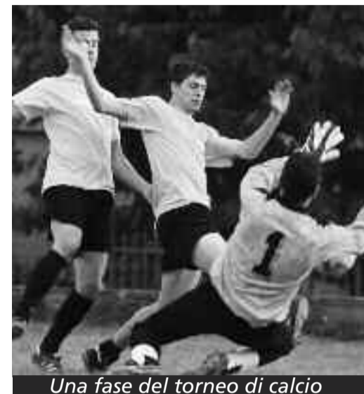
Una fase del torneo di calcio

Presidente di U.R.CA. membro Comitato Organizzatore TdR 2010