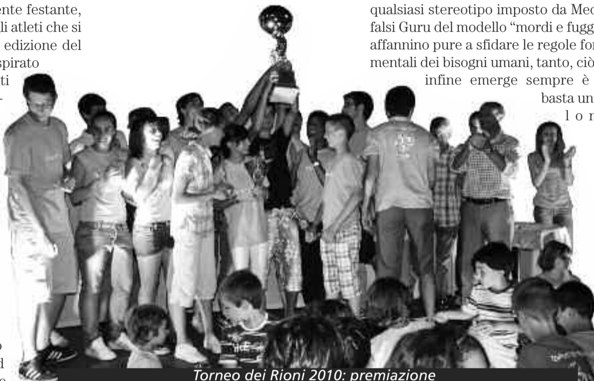
Torneo dei Rioni 2010: premiazione

Oggi, come si suol dire "a bocce ferme", le cifre parlano chiaro: ben 300 atleti, di tutte le età, si sono esibiti in 10 discipline sportive per conquistare l'ambito trofeo. Sono numeri che, soltanto pochi mesi fa, sembravano chimere e che invece hanno suggellato il desiderio d'aggregazione della gente, onorando il