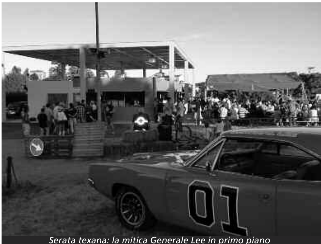
Serata texana: la mitica Generale Lee in primo piano