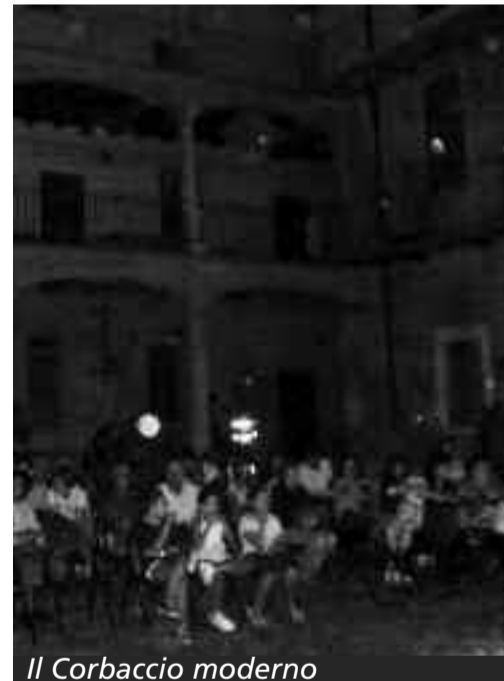
Il Corbaccio moderno