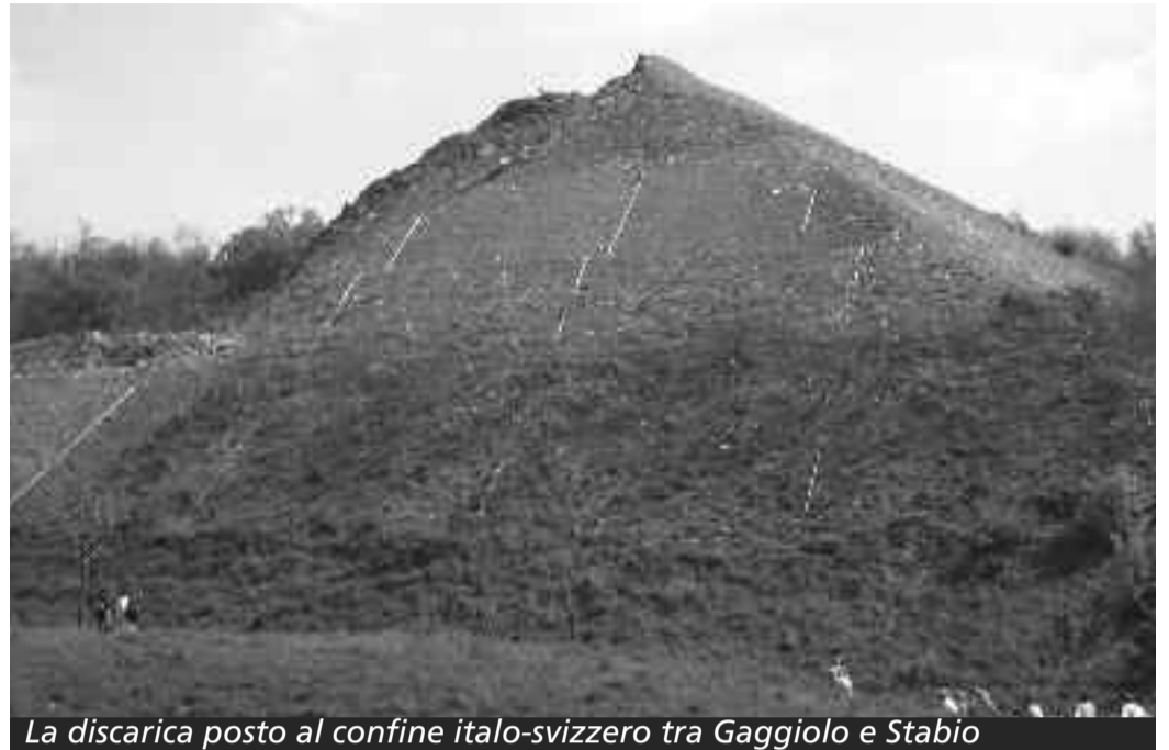
La discarica posta al confine italo-svizzero tra Gaggiolo e Stabio

La controversa discarica di materiale inerte situata appena oltre il confine a Gaggiolo continua la sua attività, anzi, raddoppia in quanto è già stata avviata la tappa 2 che prevede l'accumulo di 480.000 metri cubi di materiali nell'arco dei prossimi otto anni.