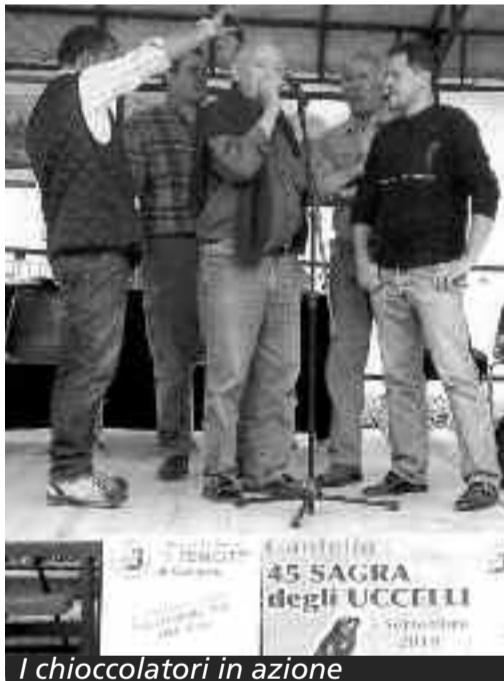
I chioccolatori in azione