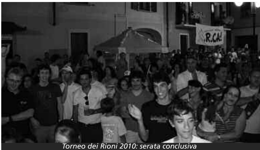
Torneo dei Rioni 2010: serata conclusiva