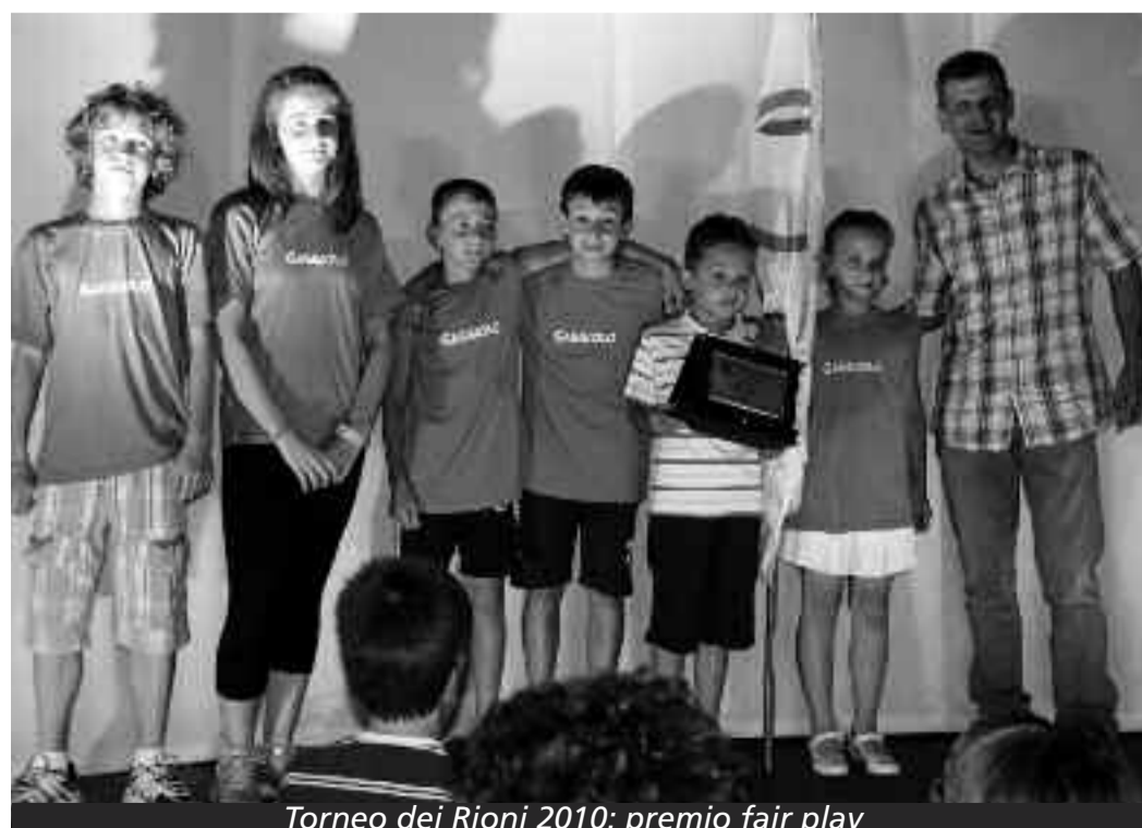
Torneo dei Rioni 2010: premio fair play