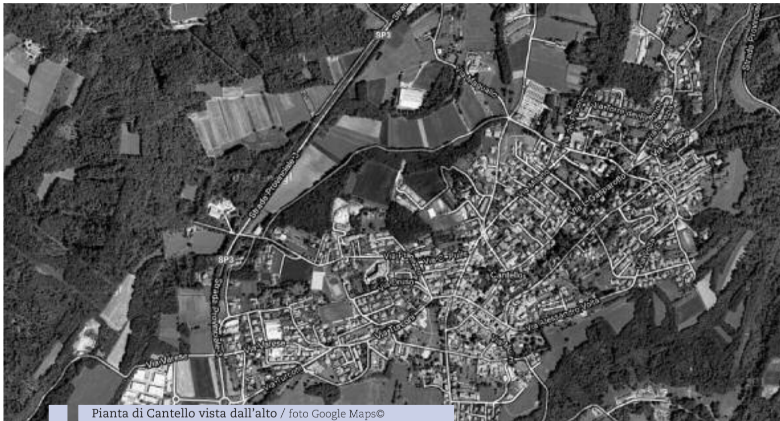
Pianta di Cantello vista dall'alto