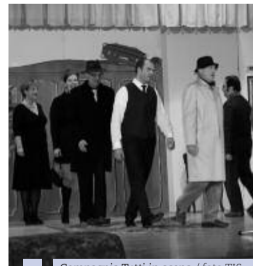
Compagnia Tutti in scena