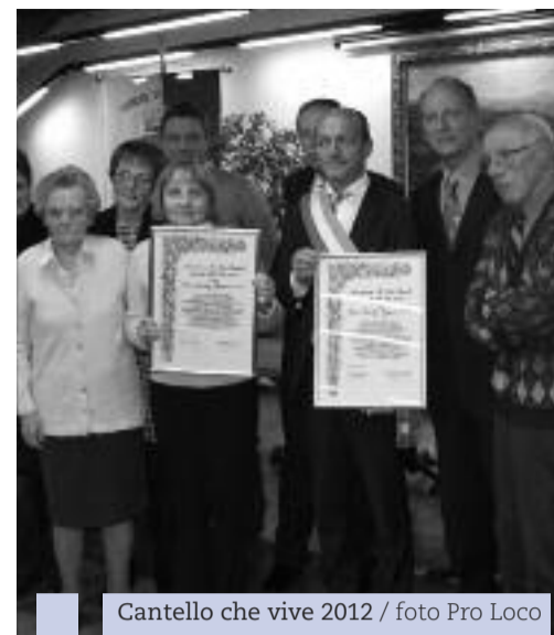
Cantello che vive 2012