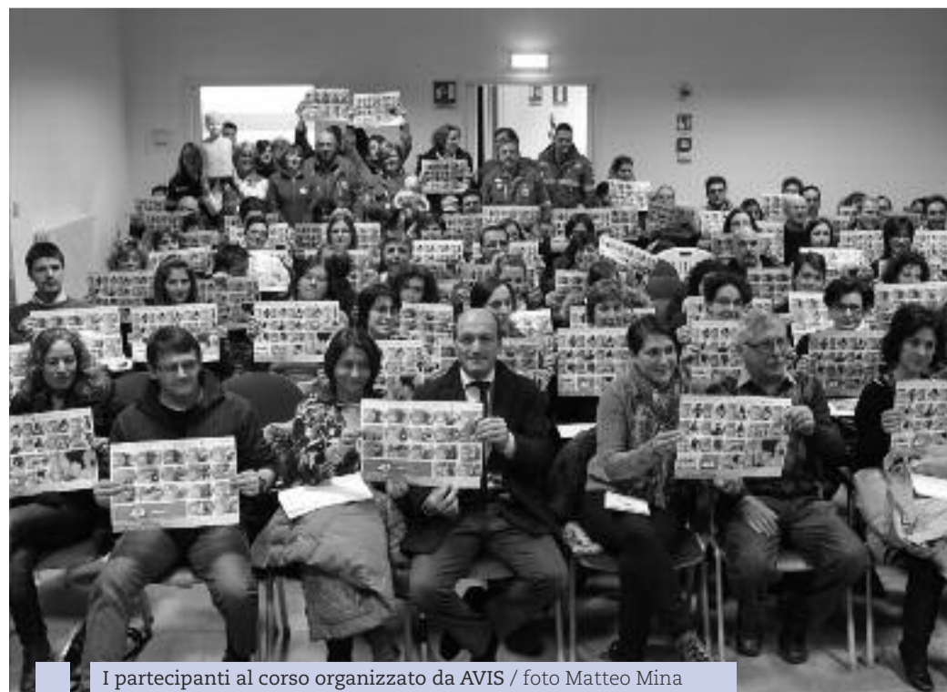
I partecipanti al corso organizzato da AVIS