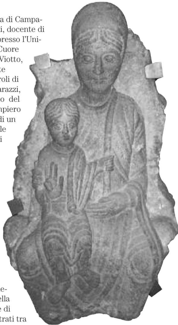
Madonna con bambino, Lanfranco da Ligurno / Museo Baroffio, Varese