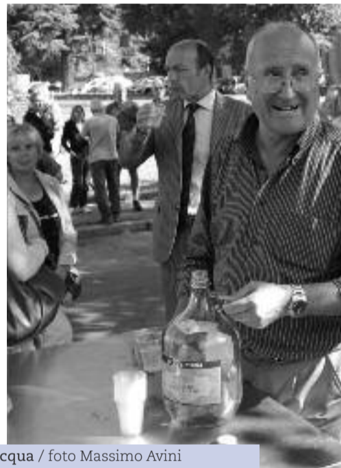
L'inaugurazione della casa dell'acqua