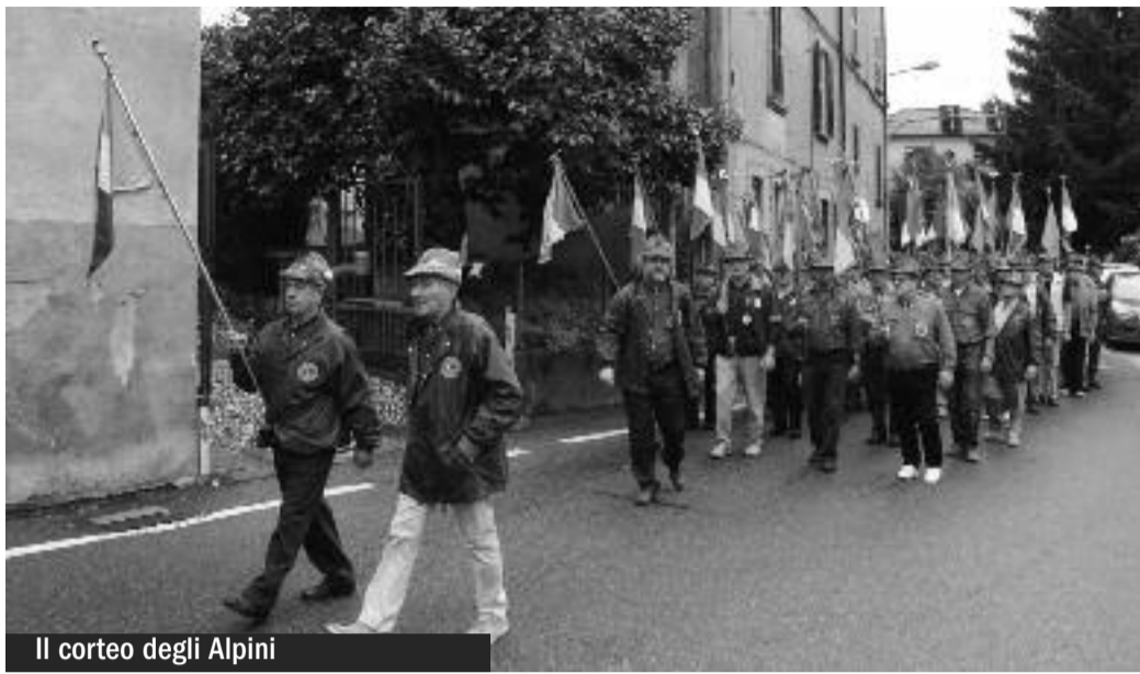
Il corteo degli Alpini

La festa per i 90 anni degli Alpini di Cantello