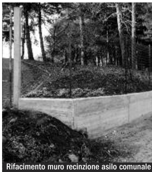
Rifacimento muro recinzione asilo comunale