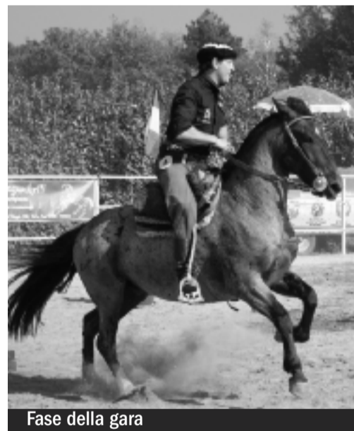
Fase della gara

Capacità tecnica, errori, ostacoli fanno di questa gara un insieme di spettacolo al quale il pubblico vorrebbe partecipare