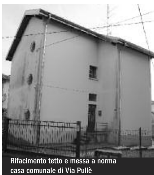
Rifacimento tetto e messa a norma casa comunale di Via Pullè