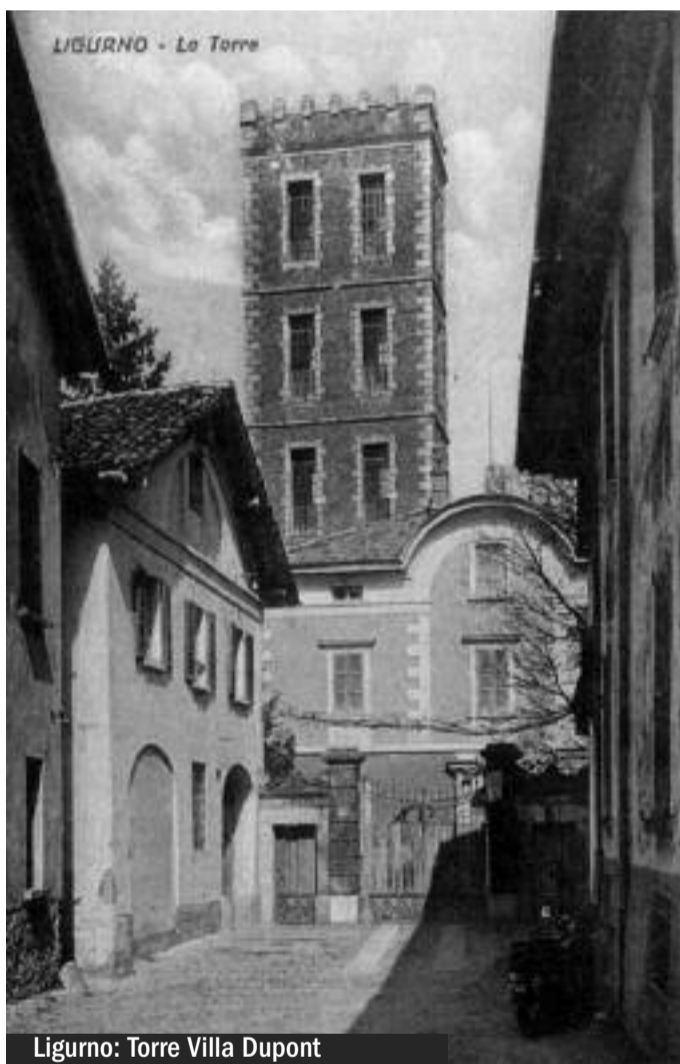
Ligurno: Torre Villa Dupont

Riqualificazione e benessere del complesso Montigo a Ligurno