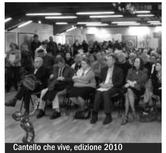
Cantello che vive, edizione 2010

"CANTELLO CHE VIVE" 16a edizione. E' il tradizionale appuntamento che si propone di ricordare e valorizzare le eccellenze della nostra comunità e che