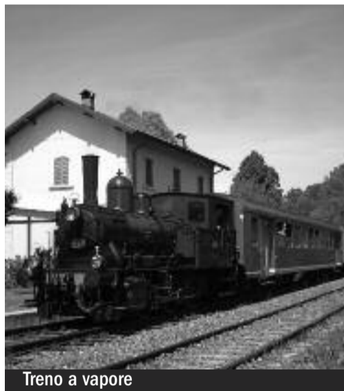
Treno a vapore

La Ferrovia Valmorea ha chiuso la stagione turistica 2011 con un buon risultato, incoraggiante per i volontari che prestano la loro opera e promettente per il futuro e la continuità del servizio. Infatti, oltre alle 5 giornate di treni a vapore aperte al pubblico, sono stati effettuati 3 treni speciali con musica dal vivo, 7 per gruppi e ricorrenze, 2 per le scolaresche (Scuole in Carrozza) e uno per una spettacolare esercitazione dimostrativa della Croce Rossa. Particolarmente apprezzato l'impiego, nelle occasioni più importanti, della "Composizione Storica Primo Novecento" con le leggendarie carrozze salone della Gotthardbahn: un autentico museo su rotaia che, percorrendo la