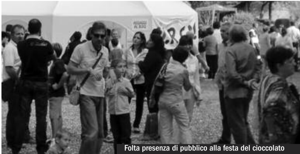
Folta presenza di pubblico alla festa del cioccolato

La Festa del Cioccolato giunta alla terza edizione