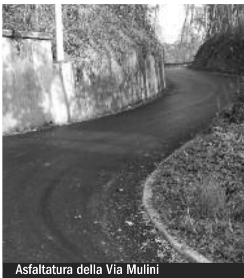
Asfaltatura della Via Mulini