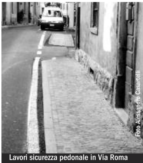
Lavori sicurezza pedonale in Via Roma

GALLERIA FOTOGRAFICA ULTIMI LAVORI EFFETTUATI