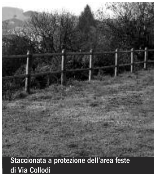
Staccinata a protezione dell'area feste di Via Collodi