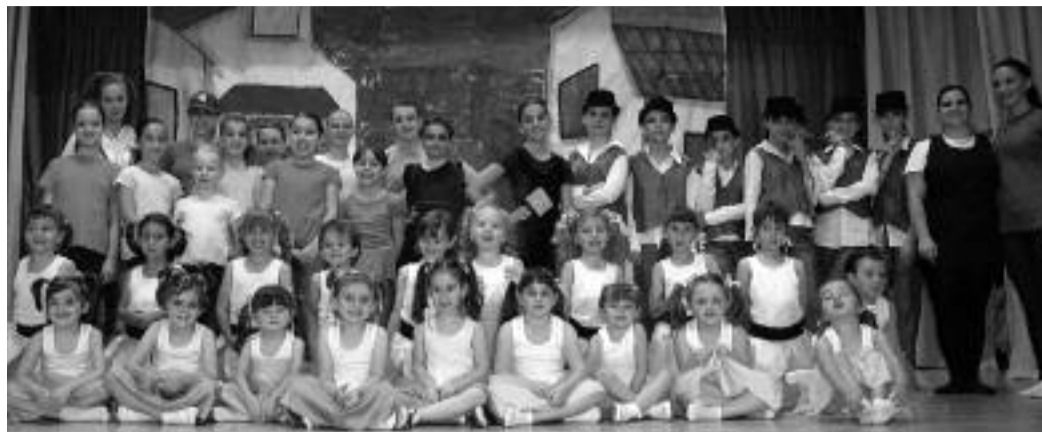
Foto di gruppo al saggio 2011

La ginnastica ritmico artistica di Cantello