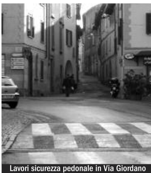
Lavori sicurezza pedonale in Via Giordano